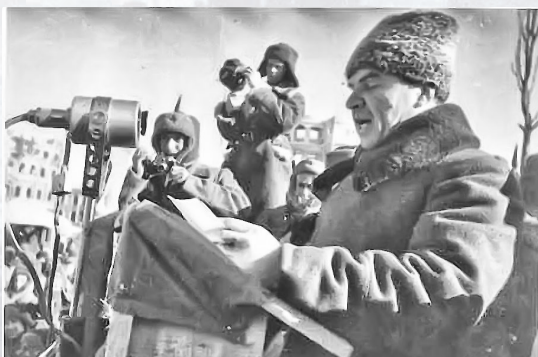
В.И.Чуйков выступает на митинге победителей. Сталинград, 4 февраля 1943 года

Выступая на площади Павших Борцов 4 февраля 1943 года, взволнованный Чуйков говорил о том, что защитники Сталинград сдержали слово, данное Родине, – «Мы отстоим Сталинград или там погибнем» .