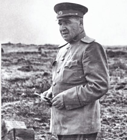
Главнокомандующий группой Советских войск в Германии. Германия, 1949 год

После войны и до 1949 года Чуйков занимает должность 1-го заместителя Главнокомандующего группой оккупационных войск в Германии, с 1949 по 1953 год – Главнокомандующего группой Советских войск в Германии. С 1953 по 1960 год командует войсками Киевского военного округа, с 1961 по 1972 год – возглавляет Гражданскую оборону СССР, с 1972 года – служит в группе генеральных инспекторов Минобороны СССР.