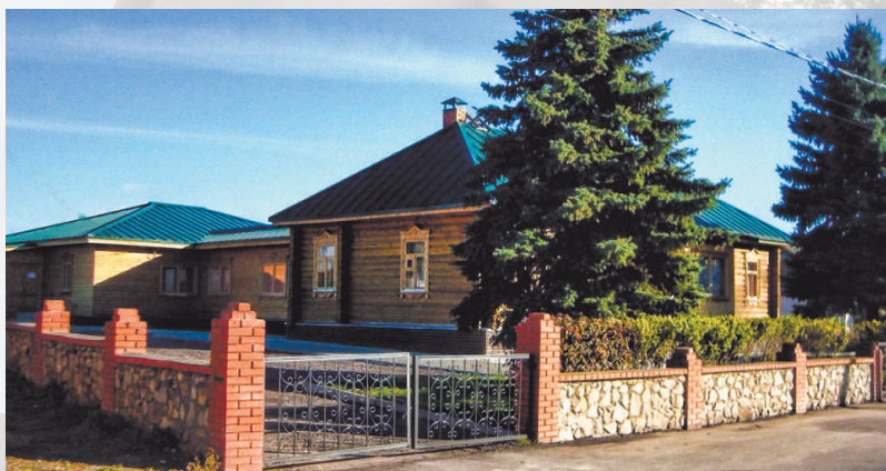
Мемориальный Дом-музей дважды Героя Советского Союза, Маршала Советского Союза В.И. Чуйкова

Жителей этого легендарного города и серебрянопрудцев связывают узы крепкой дружбы. Основа этой дружбы – патриотизм, сбережение нравственного достояния прошлого, преумножение славных традиций предков.