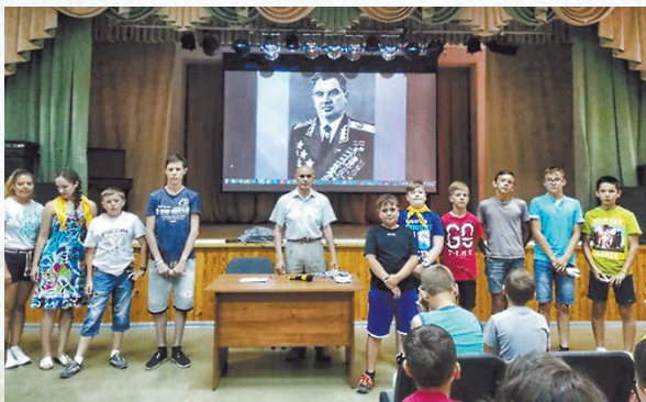
Проведение викторины «Жизнь и деятельность В.И.Чуйкова» работниками музея в школе имени Маршала Чуйкова

Учащиеся Серебряно-Прудской средней общеобразовательной школы имени Маршала В.И.Чуйкова – постоянные посетители музея и участники мероприятий, посвященных прославленному земляку. В школе создан краеведческий музей, значительная часть экспонатов которого посвящена В.И.Чуйкову.