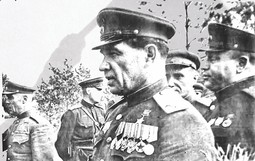
Германия, 1945 год

Освобождение Одессы было осуществлено сложным обходным маневром и ударом главными силами армии совместно с другими соединениями. Чуйков умело применил тактику перерастания разведки боем в наступление главных сил армии. В результате 8-я гвардейская армия прорвала оборону и вместе с танками вышла на оперативный простор.