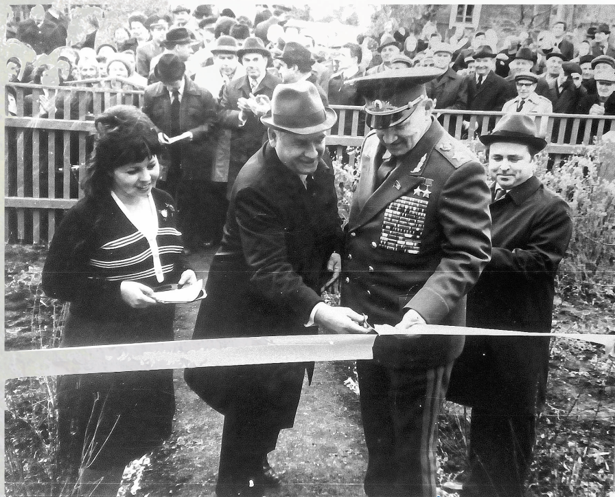
Открытие Дома-музея В.И.Чуйкова. Серебряные Пруды, 17 мая 1980 года

Умер маршал 18 марта 1982 года. Похоронен Василий Иванович, согласно его завещанию, в Волгограде, на Мамаевом Кургане.