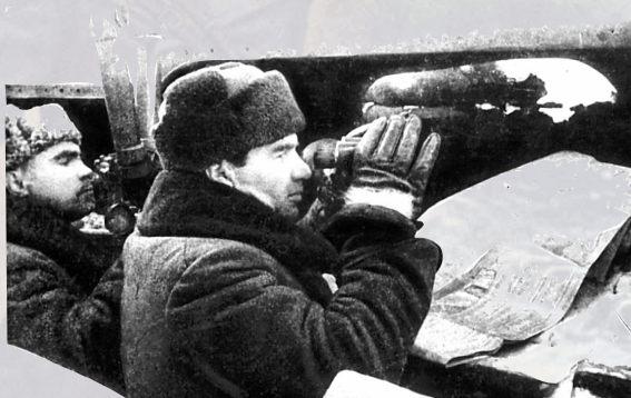
К.А.Гуров, В.И.Чуйков на наблюдательном пункте. Сталинград, 1942 год

военачальника. Бои в разрушенном городе требовали новых тактических решений, и Чуйков их находит, разрабатывая тактику ближнего боя и штурмовых групп.