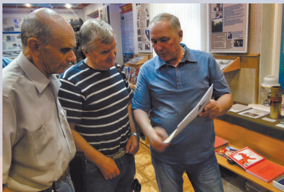
Серебрянопрудцы по праву гордятся легендарным земляком и свято чтут память о нем