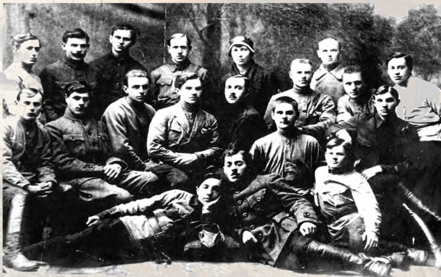
В.И. Чуйков – слушатель академии им. М.В.Фрунзе, 1925 год

Детство Василия Ивановича Чуйкова закончилось в 12 лет. Нужда заставила оставить родительский дом и податься в Петербург на заработки. Сначала он работал мальчиком в частной бане и меблированных комнатах, а затем в шпорной мастерской.