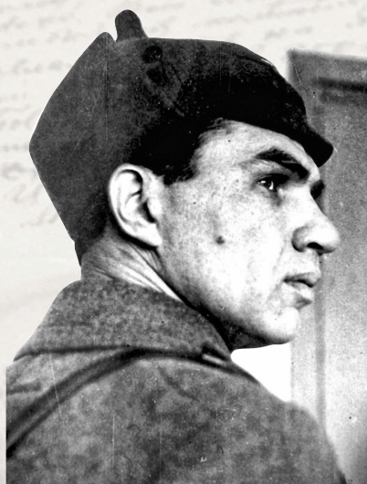
Командир полка. 1919 год

Мечтая о настоящем деле, о ратных подвигах, 18-летний юноша вступил в ряды Красной армии. Василий Чуйков поступает на военно-инструкторские курсы, а после их успешного окончания принимает командование полком.