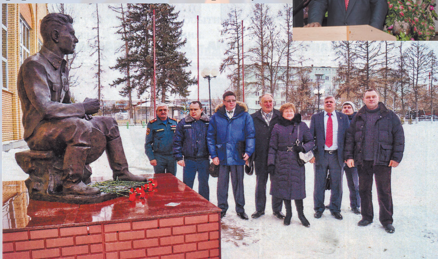
Делегация Ассоциации у памятника В.И. Чуйкову в Серебряных Прудах. 2015 год