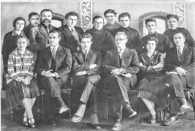
В.И.Чуйков среди работников Советского посольства Китая. 1928 год

С 1932 года В.И.Чуйков – начальник курсов по усовершенствованию начальствующего состава армии. Обучая других, он еще раз убедился, что и самому надо постоянно повышать свои знания. С этой целью Василий Иванович окончил академические курсы при Военной академии механизации и моторизации РККА.