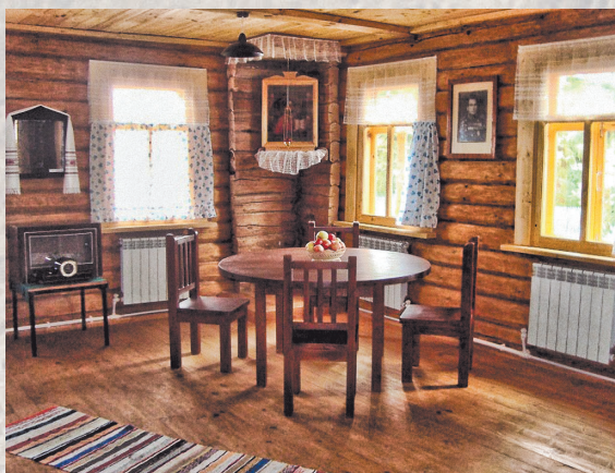
Экспозиции комплекса «Дом-музей В.И.Чуйкова»