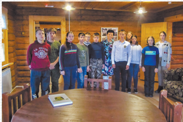
Учащиеся школы г. Москвы имени Маршала В.И.Чуйкова в Доме-музее В.И.Чуйкова