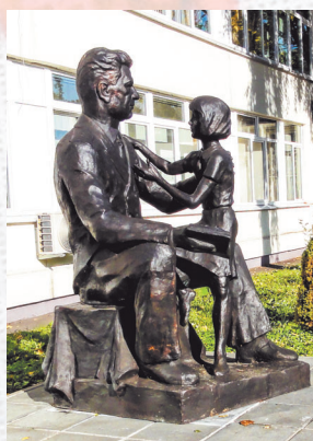
Памятник маршалу на территории школы

Учащиеся школы каждый год уточняют списки ветеранов войны 62-й армии, ветеранов районов Кузьминки и Рязанский, следят за состоянием памятников.