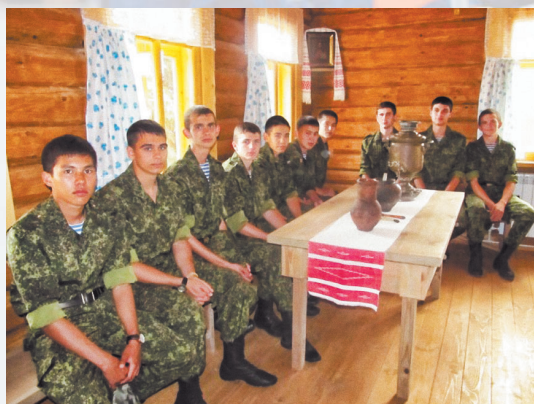
Воспитанники лицея в Доме-музее В.И. Чуйкова

12 февраля, в день рождения легендарного маршала учащиеся лицея проводят митинги памяти, возлагают гирлянды цветов к подножию памятника и на могилу Чуйкова.