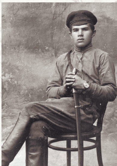
После награждения именными часами «Омега». 1918 год

В 1925 году Чуйков окончил командный факультет Военной академии имени Фрунзе, и ему предложили поступить на китайское отделение восточного факультета, на котором он проучился до 1927 года. Затем два года работал в Китае военным советником. Вернувшись, получил новое назначение – начальником отдела в штаб Особой Дальневосточной армии, которой командовал В.К.Блюхер. Здесь молодой командир получил возможность изучить стиль работы этого известного военачальника во время проведения военных действий против войск Чан Кайш и в период конфликта 1929 года на КВЖД.