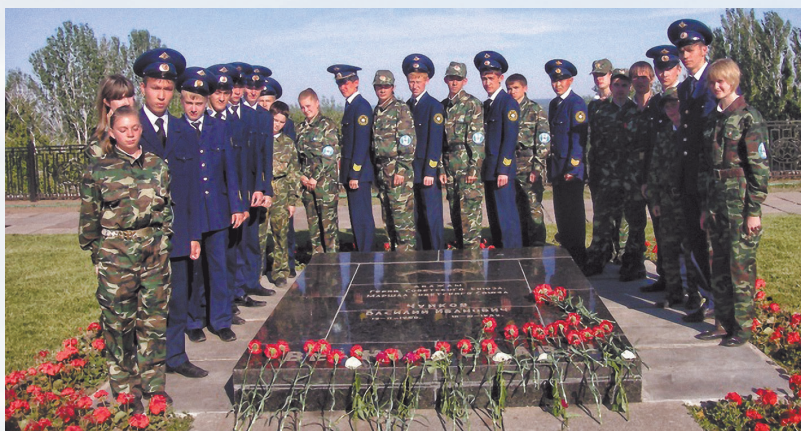
Могила Маршала В.И. Чуйкова. Валгоград, Мамаев Курган

Жителей этого легендарного города и серебрянопрудцев связывают узы крепкой дружбы. Основа этой дружбы – патриотизм, сбережение нравственного достояния прошлого, преумножение славных традиций предков.