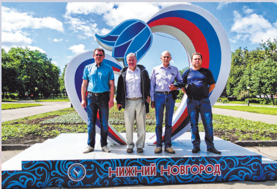
Визит делегации из Серебряных Прудов в Учебно-методический центр по ГО и ЧС Нижегородской области им. Маршала В.И.Чуйкова

Дружеские отношения между Серебряными Прудами и Центром, возникшие в 2013 году, крепнут с каждым годом.